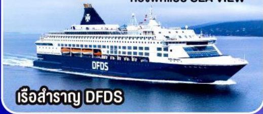
เรือสำราญ DFDS