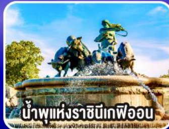
น้ำพุแห่งราชินีเกฟิออน