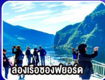
ล่องเรือของฟยอร์ด