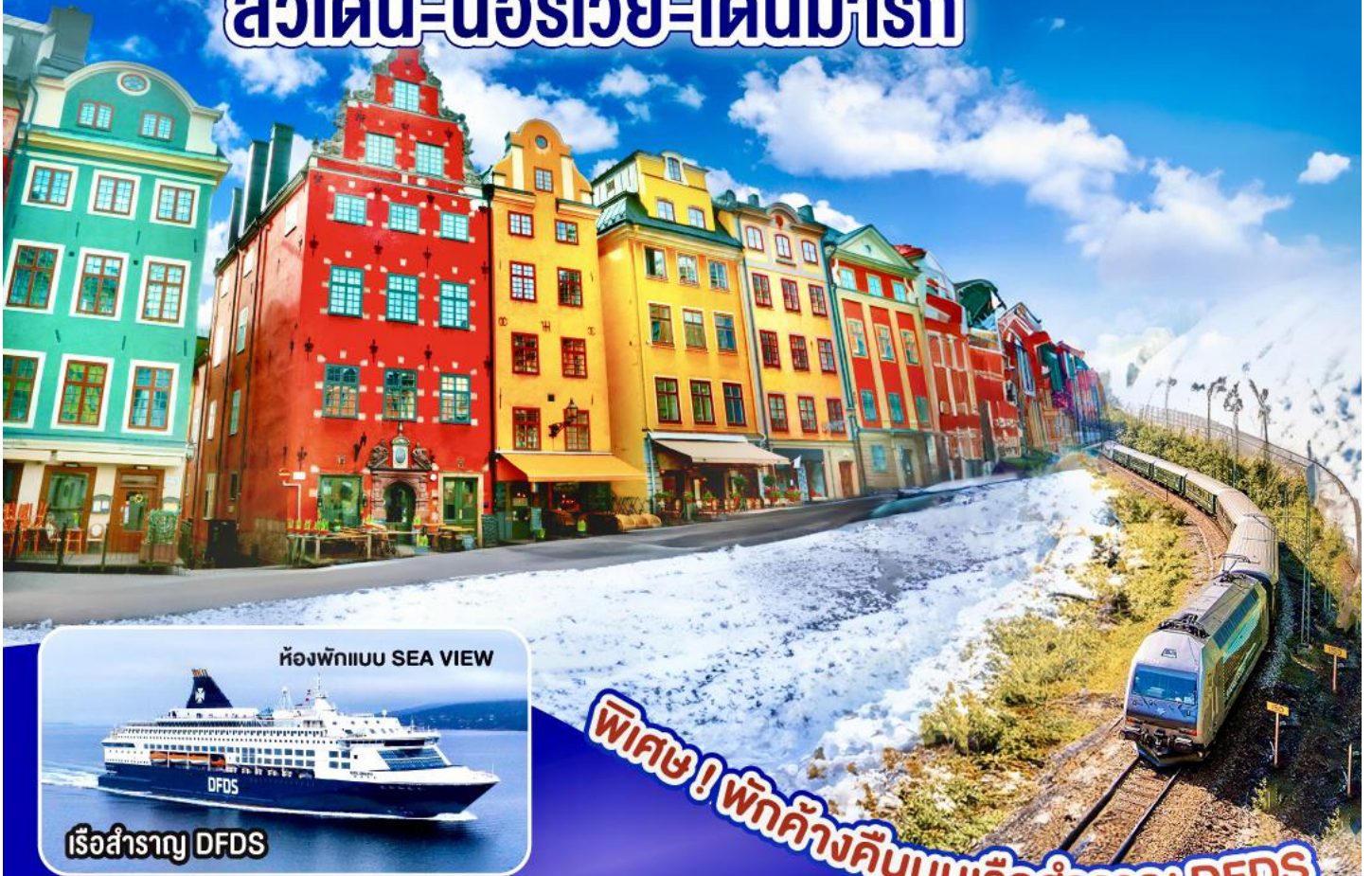
ห้องพักแบบ SEA VIEW